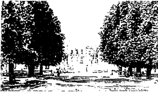
Aquarell des Schlosses Hetzendorf aus 1832

Auch im 19. Jahrhundert scheinen die Namen bekannter historischer Persönlichkeiten unter den Bewohnerinnen und Bewohnern auf. Nach einem abenteuerlichen Leben in den Wirren der Napoleonischen Kriege starb 1814 Maria Karolina, Königin von Neapel-Sizilien und eine Tochter Maria Theresias, in Hetzendorf. 1848 leitete Fürst Windischgrätz von Hetzendorf aus einige dramatische Tage lang die Belagerung der revoltierenden Residenzstadt Wien. 1873, im Jahr der Wiener Weltausstellung, waren Kaiser Franz Joseph I. sowie die Kronprinzen von Preußen und